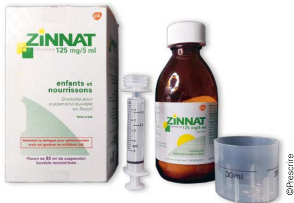
Zinnat ® (céfuroxime)

La seringue pour administration orale de Zinnat ® ( céfuroxime ), auparavant graduée en kilogrammes de poids corporel de l'enfant, est désormais graduée en millilitres. Une seringue orale graduée en mg aurait été un meilleur choix pour mesurer les doses préconisées exprimées en milligrammes de substance dans le résumé des caractéristiques (RCP). La DCI est toujours minimisée sur la boîte et sur l'étiquette du flacon, et aucune dénomination ne figure sur la seringue pour administration orale.