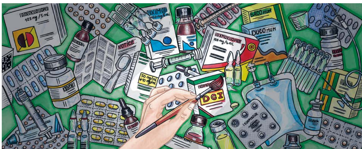
Illustration : Léa Lord