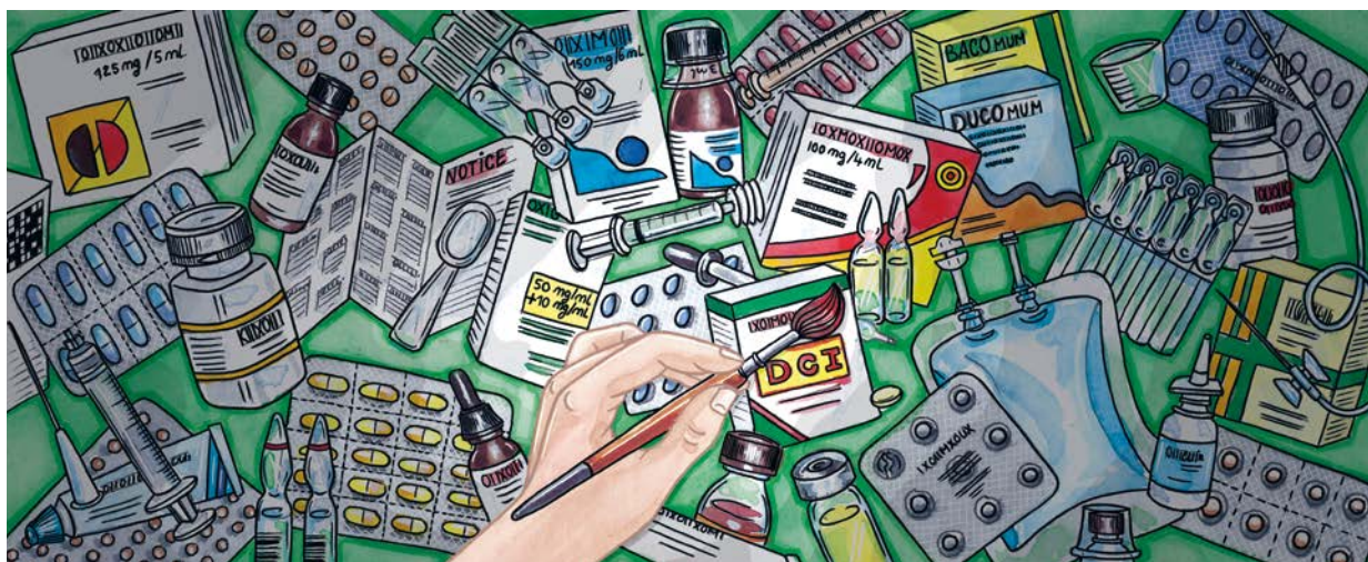
Illustration : Léa Lord